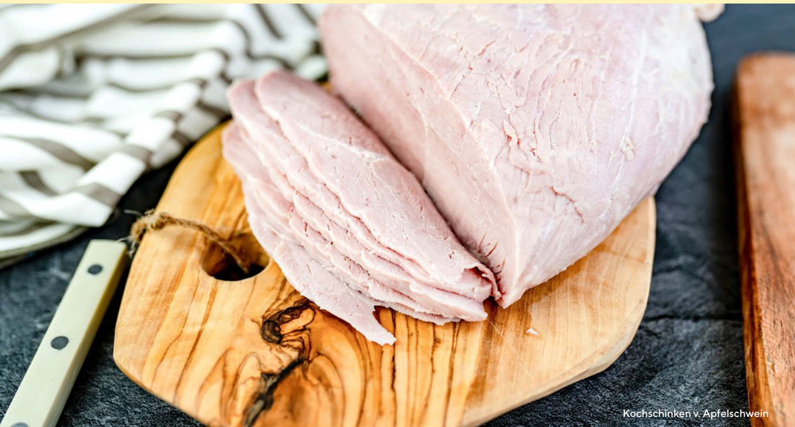
Kochschinken v. Apfelschwein